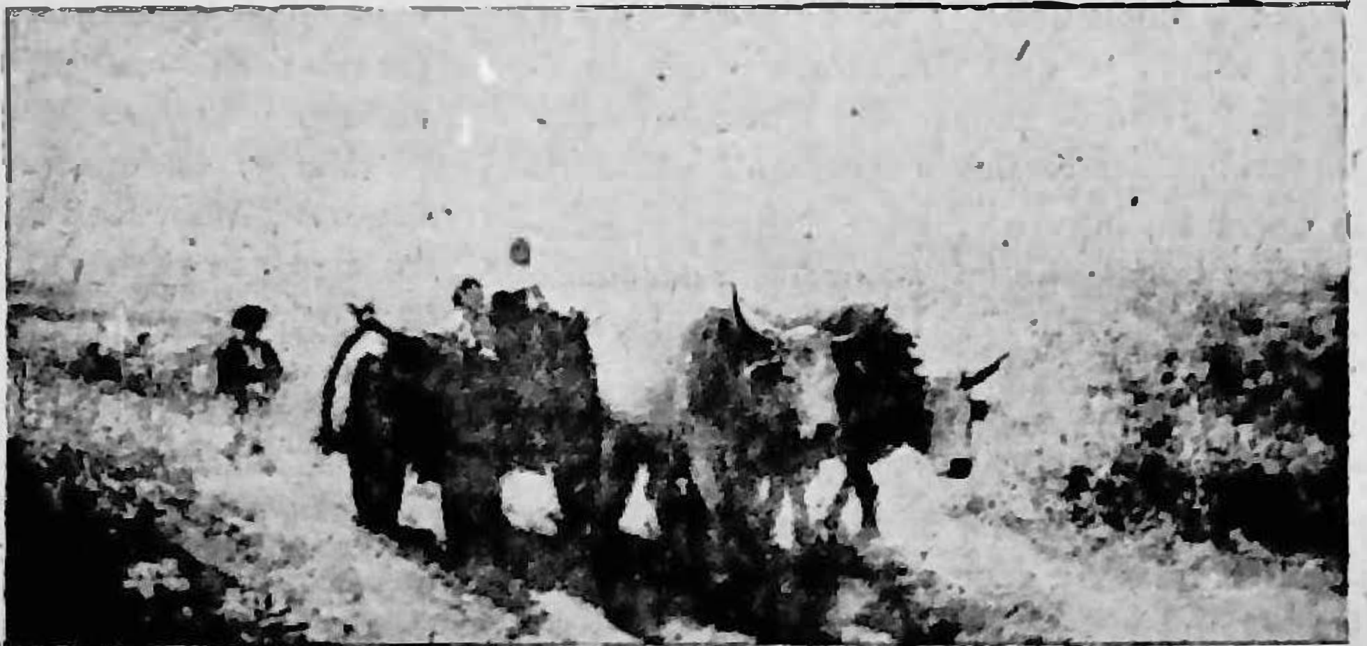
CAR CU BOI

«Pune-o nenisorule și cu tocul cismei, numai s'o pui pe cea care trebuie și s'o așezi unde trebuie».