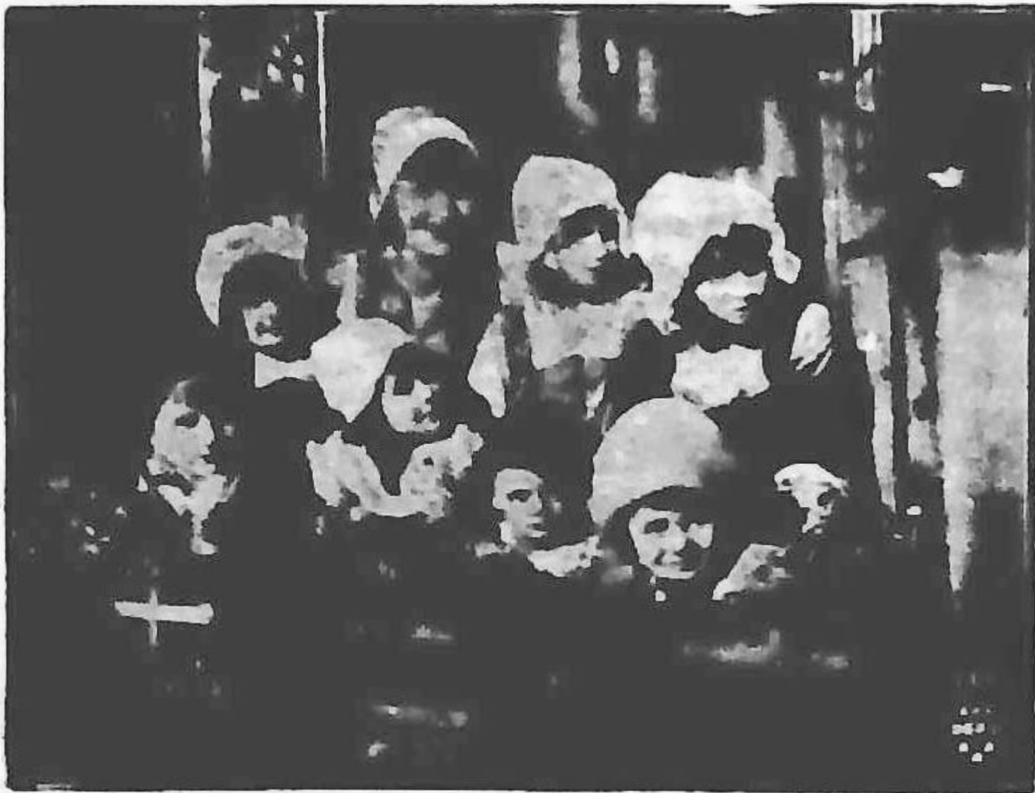
Cine o recunoaște pe LYA MARA ?

Mara, este o garanție în plus că filmul va place mult: